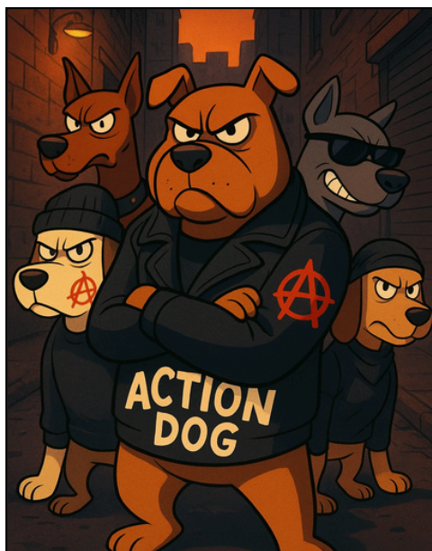
Le groupe dissident "Action Dog"

Il a été dit également que Crapaud-Léon 1er ne compte pas en rester là et qu'il y aura une réponse appropriée très prochainement.